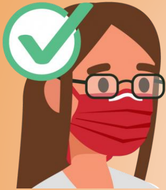
Uso correcto mascarilla