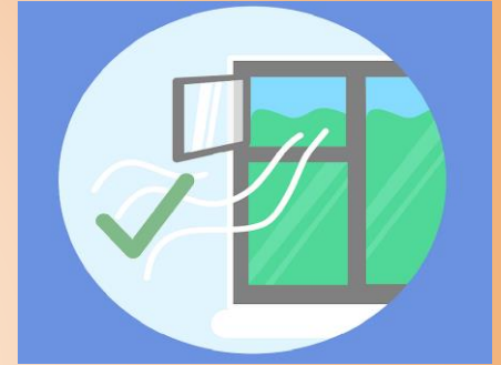
Mantener ambientes limpios y ventilados