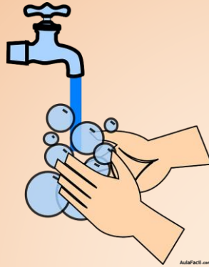
Lavado frecuente de manos